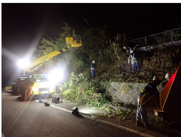
< 支障木伐採工事 >