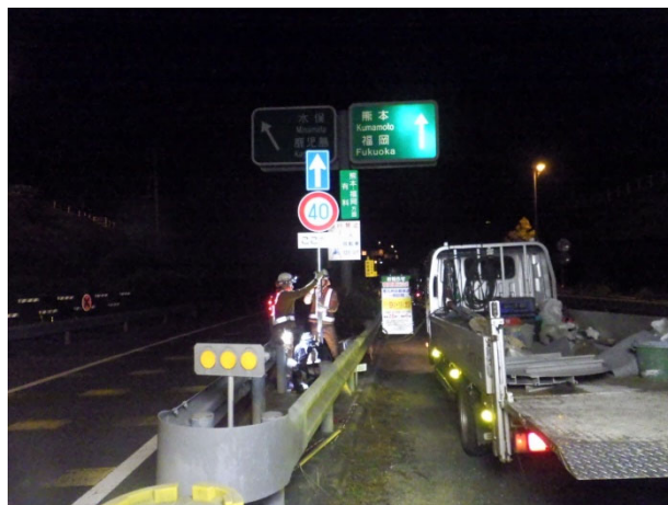
< 標識取替工事 >