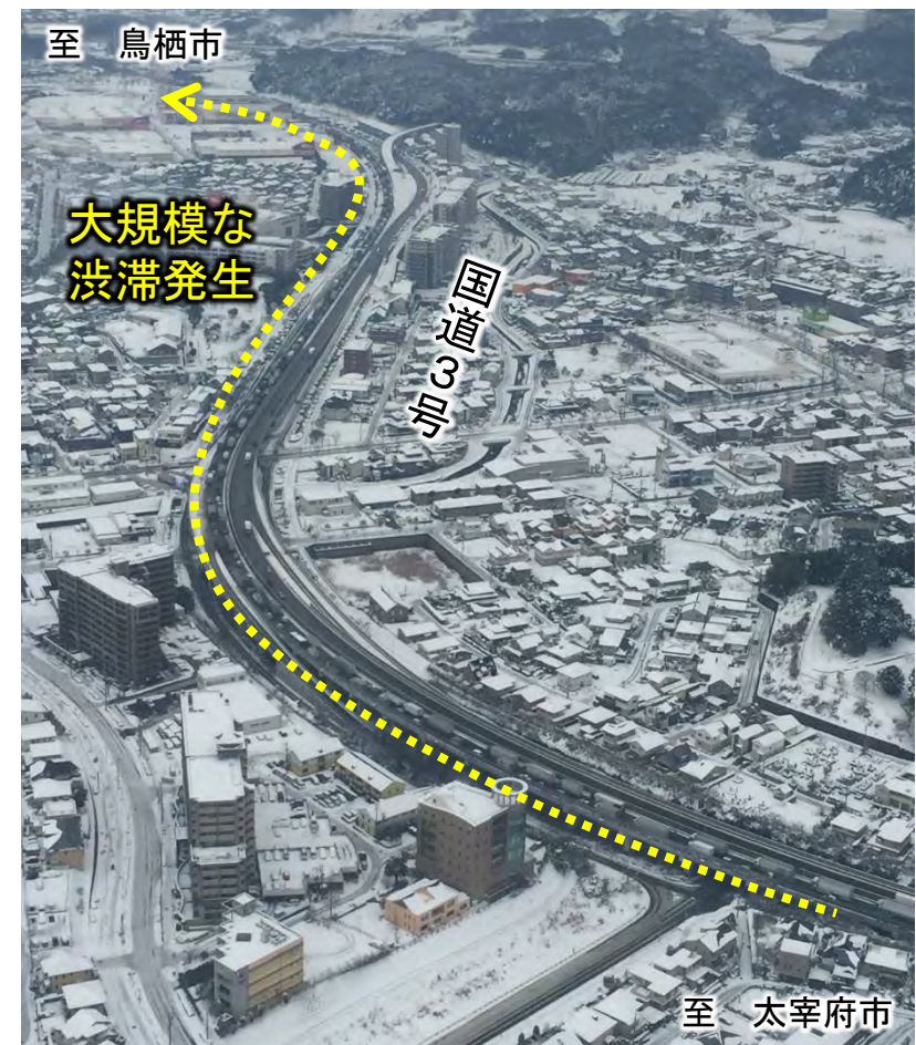
▲国道3号の渋滞状況 (福岡県筑紫野市上空)