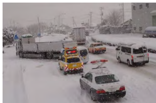
▲立ち往生車両の発生状況 (鳥栖市)