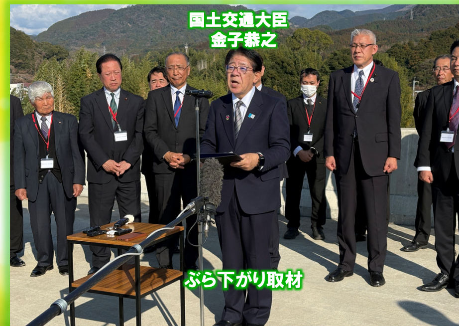
国土交通大臣 金子恭之