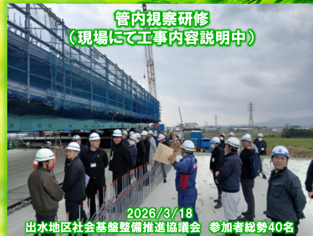
管内視察研修 (現場にて工事内容説明中)

若芽のような緑に瑞々しいエネルギーが宿ります。美しくはっきりした様子を表す「あざやか」を名前に持つように、濁りがほとんどありません。同じ色相の中で最も彩度の高い色「純色(じゅんしょく)」に近い色と考えられます。