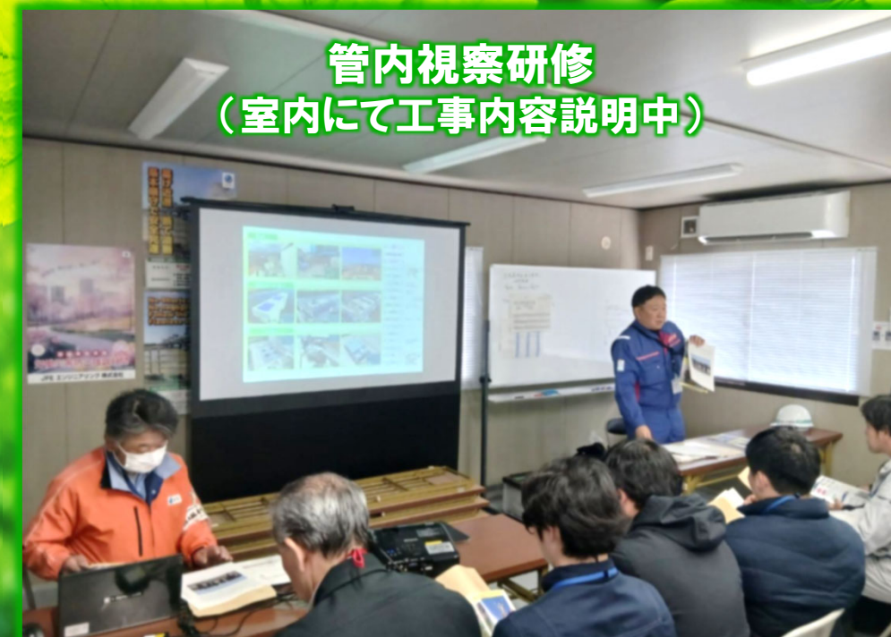
管内視察研修 (室内にて工事内容説明中)

管内視察研修では、現地及び室内で工事内容等について 八代河川国道事務所より説明を行いました。